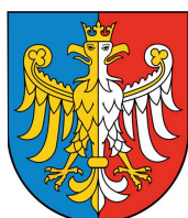
Przewodniczący Konwentu Powiatów Województwa Śląskiego, Starosta Bielski