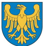
Przewodnicząca Kapituły Konkursu Marszałek Województwa Śląskiego