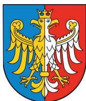
Przewodniczący Konwentu Powiatów Województwa Śląskiego, Starosta Bielski