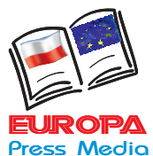
Dyrektor Konkursu Redaktor Naczelny „Życia Regionów”